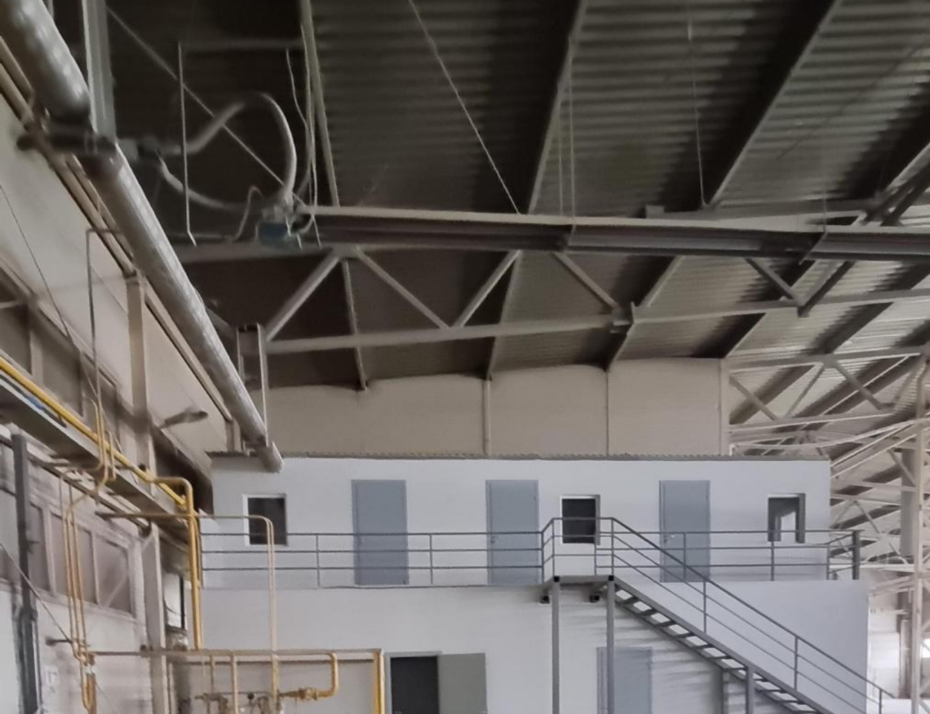
Вид объекта: Складское помещение Этаж: 1