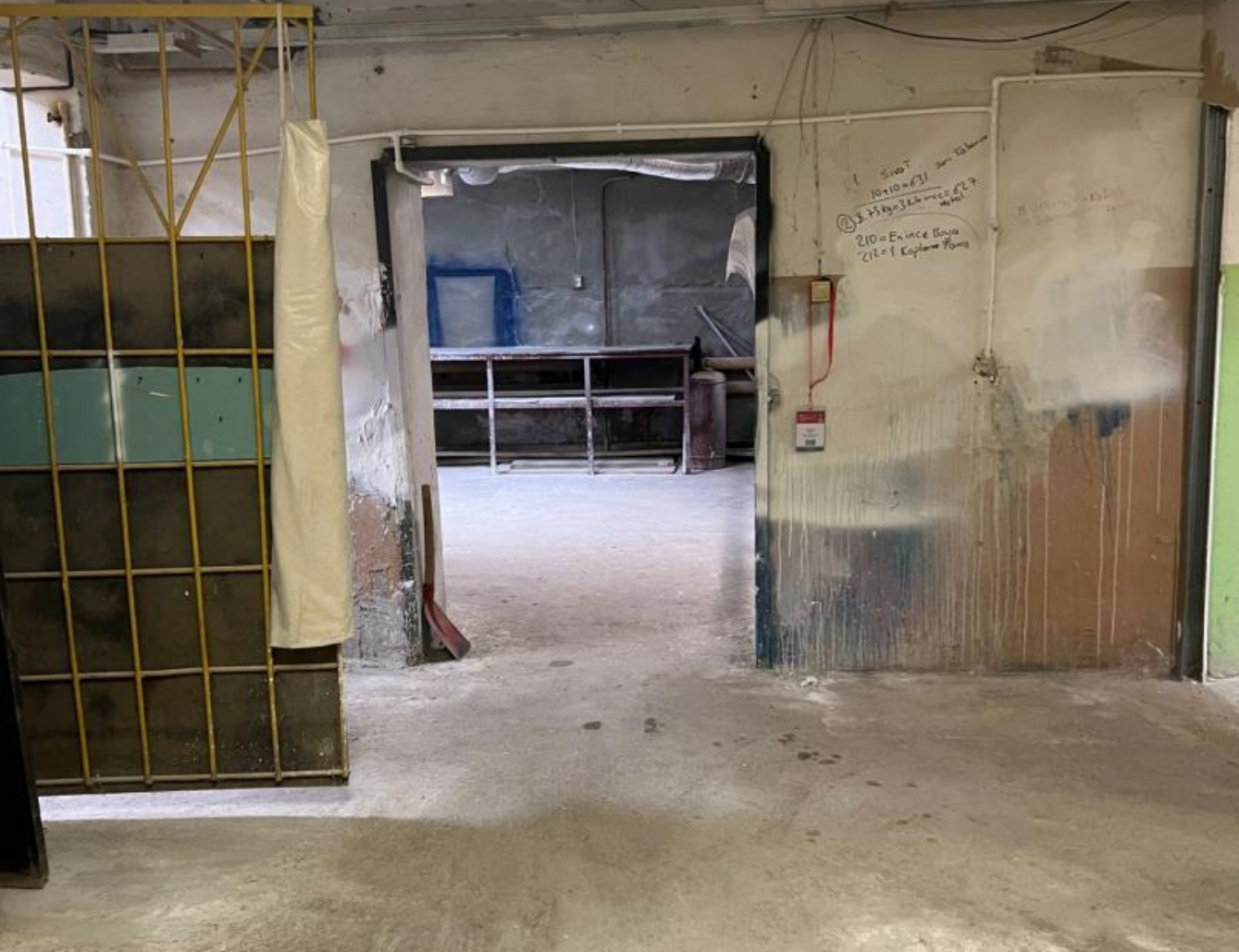
Вид объекта: Помещение свободного назначения Этаж: -1