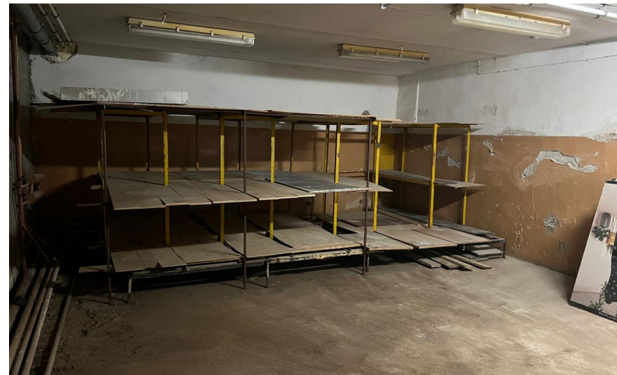
Общая площадь: 281 м 2 Этажность дома: 5