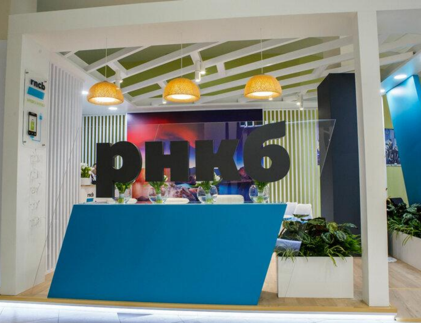
Вид объекта: Помещение свободного назначения Этаж: 1